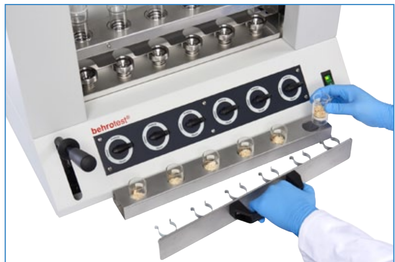
behrotest® CF 6 halbautomatisch